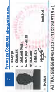
Permis de conduire