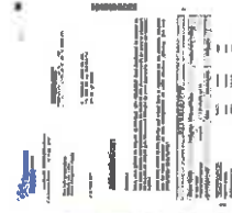
attestation d'ouverture de droits